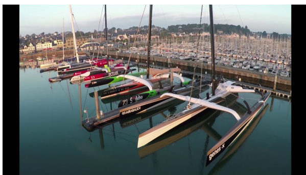
La Trinité sur mer.